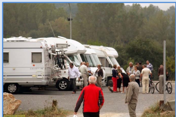
Fotos de las autocaravanas asistentes.