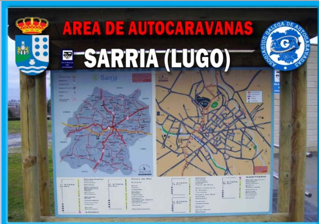
Foto: Panel turístico y plano de Sarria