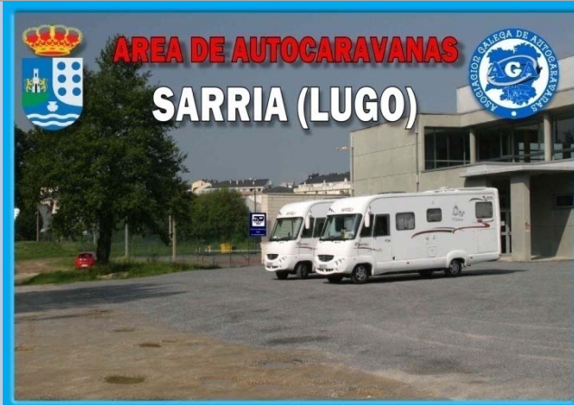
Foto: Panorámica del área de autocaravanas