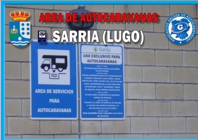
Foto: Señal y normas de uso del área