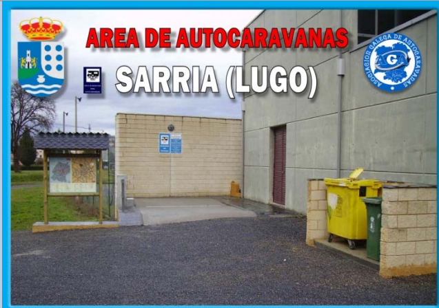
Foto: Detalle de la zona de vaciado