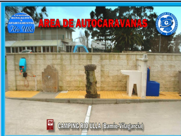
Foto: Detalle de la zona de vaciado 2