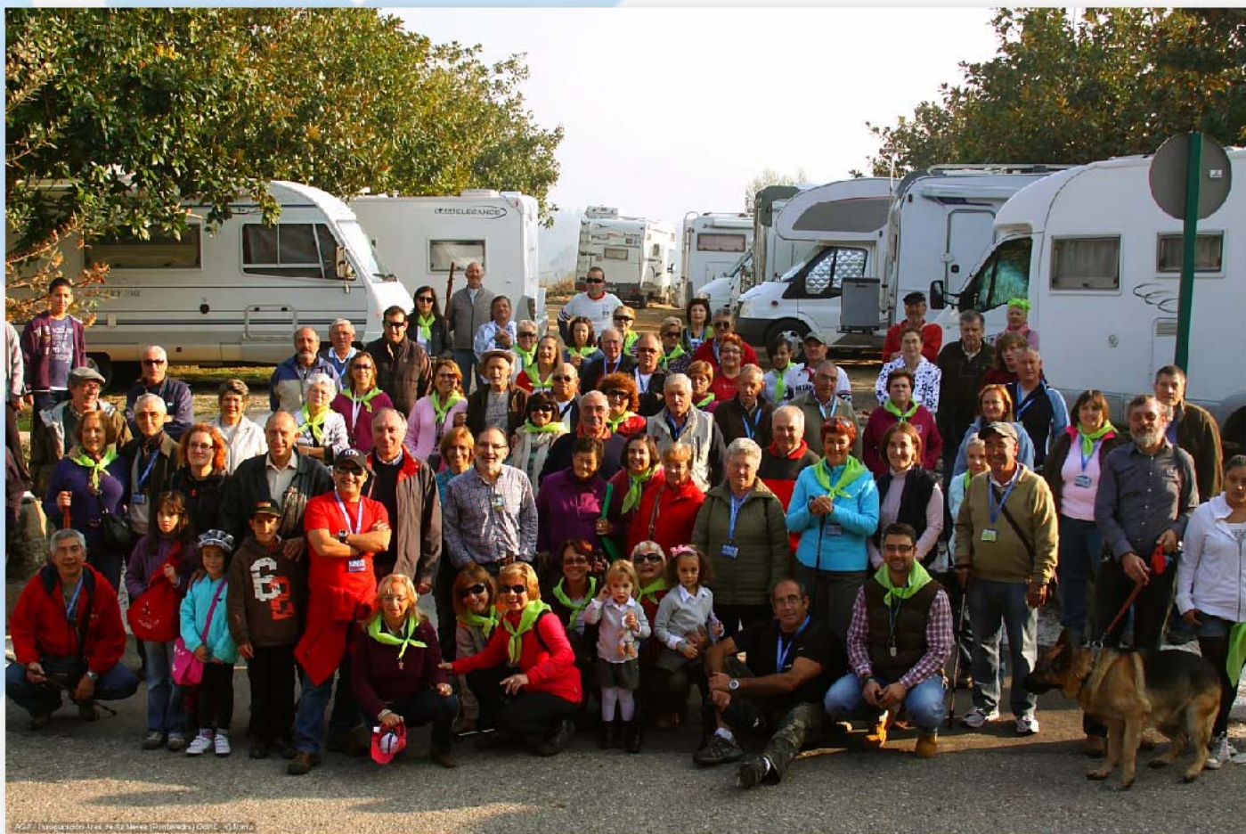
Foto de grupo de gran parte de los asistentes a la inauguración de As Neves

El Concello de As Neves (Pontevedra) invitó a todos los autocaravanistas a la concentración con motivo de la celebración de la Inauguración del Área de Autocaravanas municipal de As Neves , durante los próximos días 22, 23 y 24 de Octubre 2010. Allí se dieron cita unas 100 autocaravanas procedentes de todos los puntos de la geografía española.