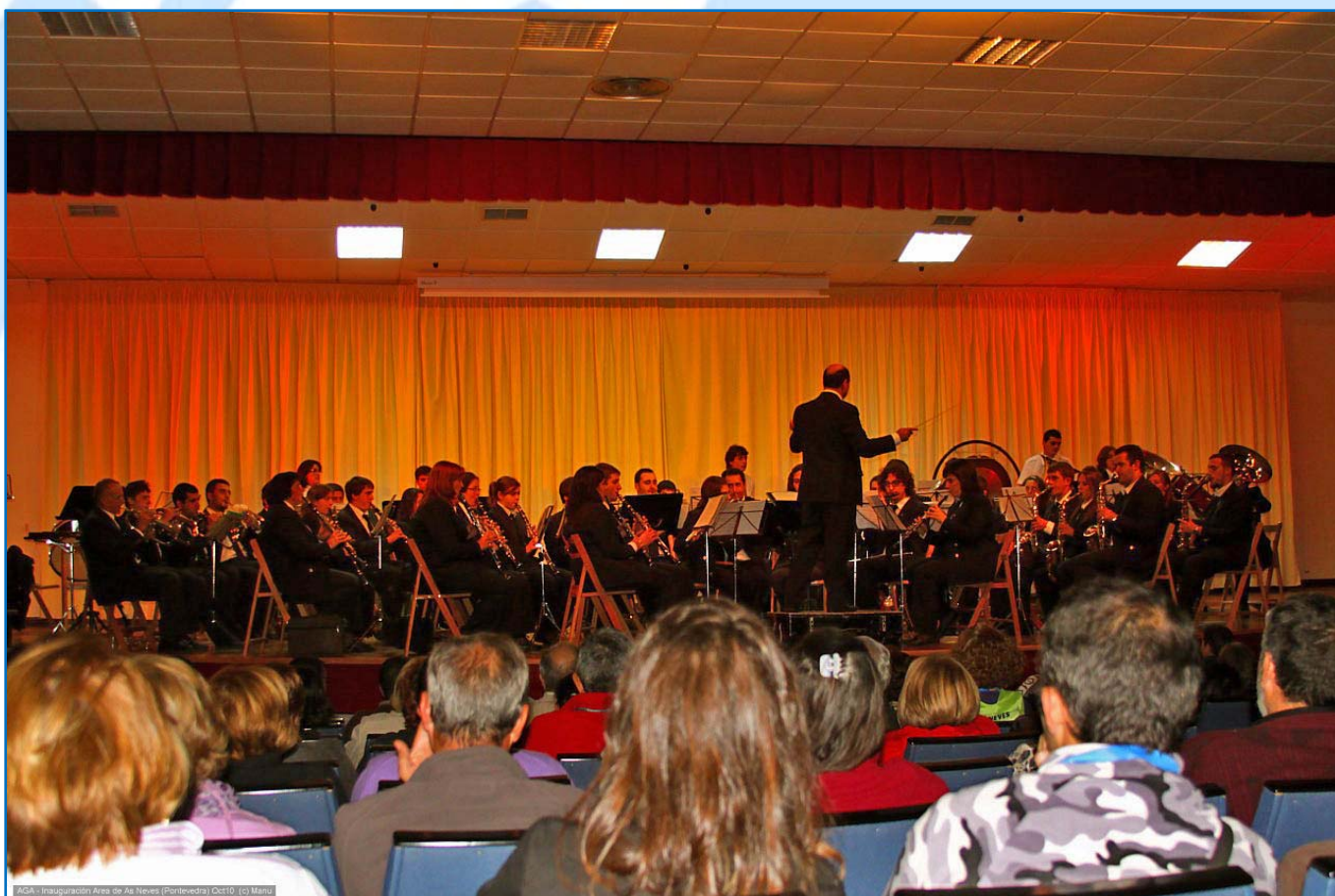
AGA- Inauguración Área de As Neves (Pontevedra) Oct10.