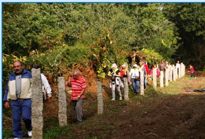
Fotos de la ruta de senderismo a orillas del río Miño