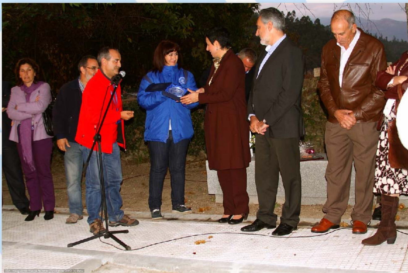
Foto: Entrega de un presente a las autoridades locales y autonómicas por parte de AGA