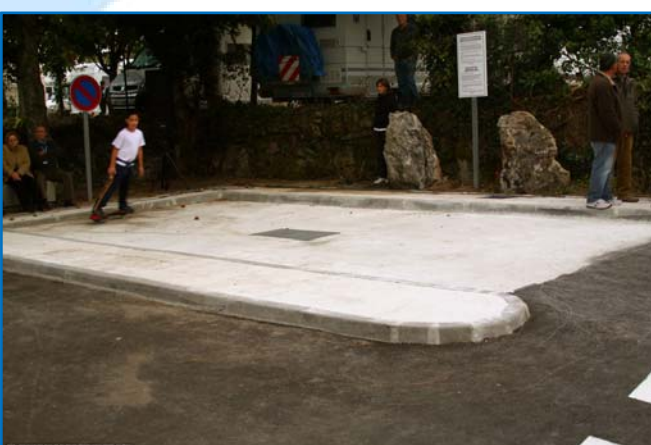
Fotos de las instalaciones del area de autocaravanas

Ya a mediados de la semana algunas autocaravanas llegaron a As Neves, aparcando en la zona para ellas reservada, pero fue durante la tarde-noche del viernes que llegaron la gran mayoría de estos vehículos en un incesante goteo hasta llegar al nº 100 a las 2 h del ya sábado.