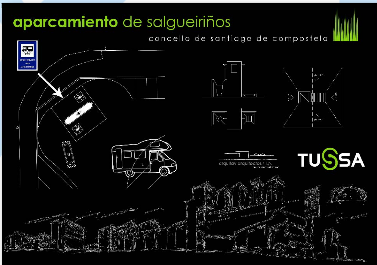
Plano-Proyecto del area de servicio autocaravanas de Santiago de Compostela (1)

AGA puso especial interés en la consecución de esta área, por la situación estratégica de Santiago como capital de Galicia y como ciudad cosmopolita que recibe numerosos peregrinos, entre los que se encontraban los autocaravanistas.