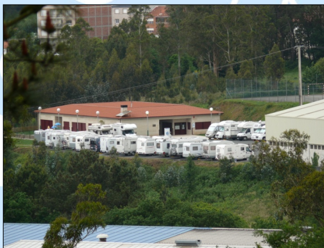
Foto del lugar de concentración en el aparcamiento del Pabellón Municipal de los deportes"