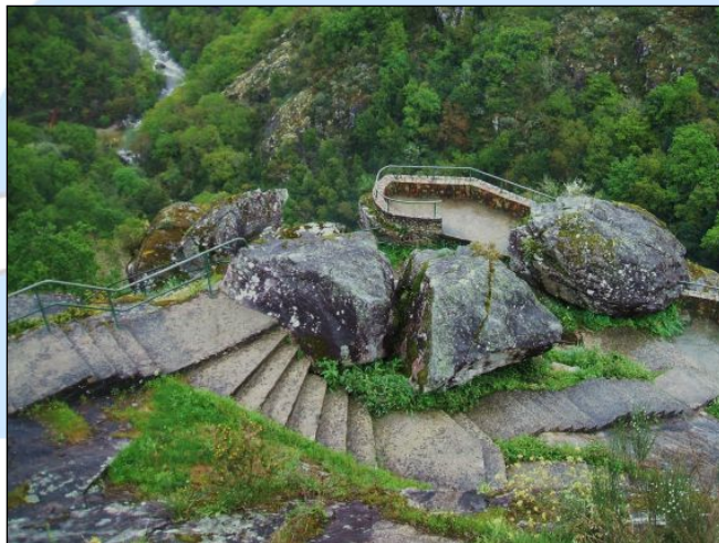
Cataratas del Rio Toxa y su mirador