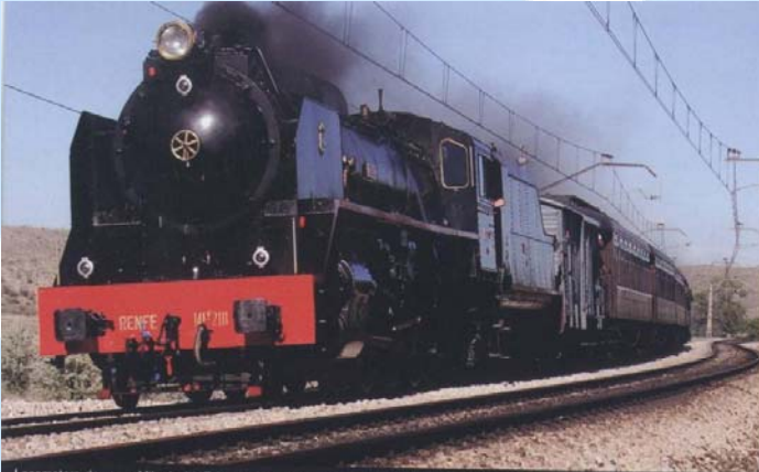
Locomotora de vapor Mikado 141F 2111 (Galicia) del muferga realizando la tracción del Tren de la Fresa Madrid-Aranjuez (2009)