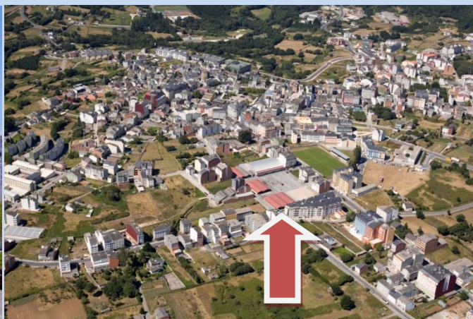
Fotos: Auditorio de Vilalba y localización del área de autocaravanas