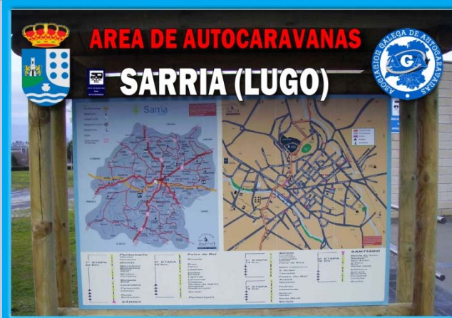
Foto: Panel turístico y plano de Sarria