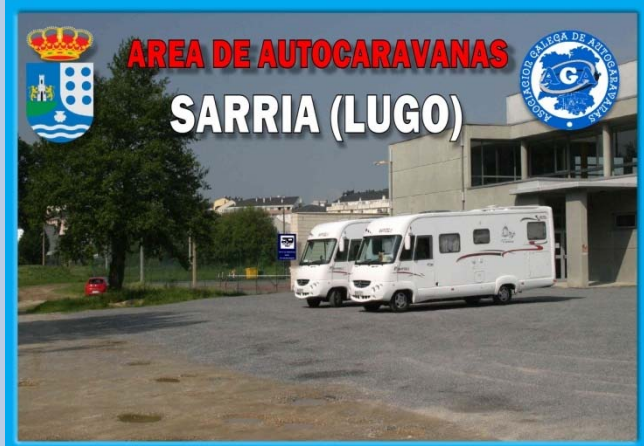
Foto: Panorámica del área de autocaravanas