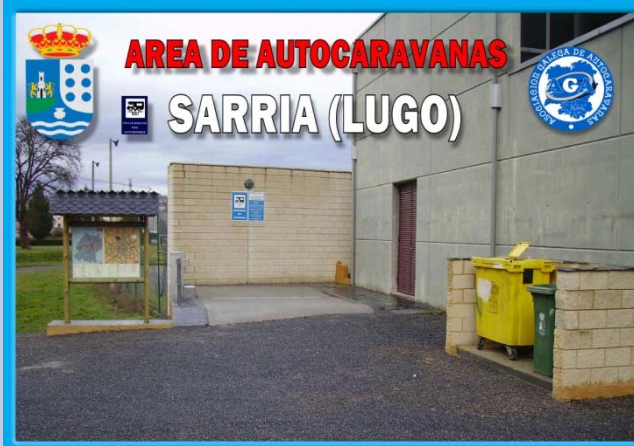
Foto: Detalle de la zona de vaciado