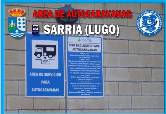
Foto: Señal y normas de uso del área